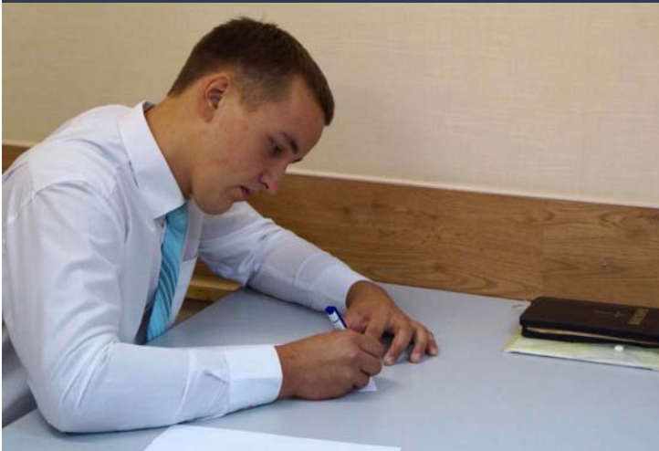
Вступительный экзамен 2016 г.

Подошел к концу 2016 год. Семинария вновь пополнила число своих студентов и выпускников. Столько новых и интересных событий! Вот лишь некоторые из них: