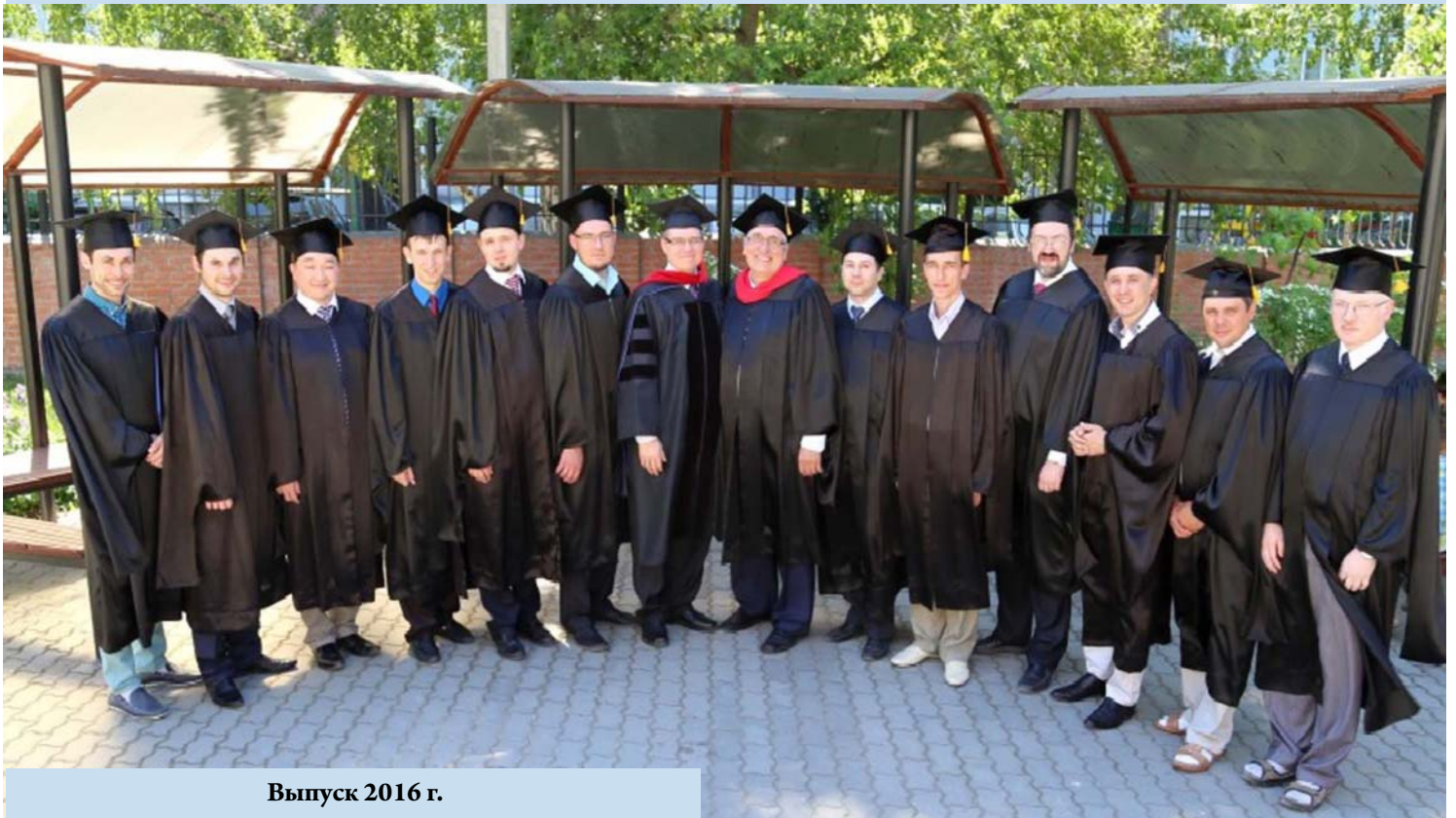
Выпуск 2016 г.